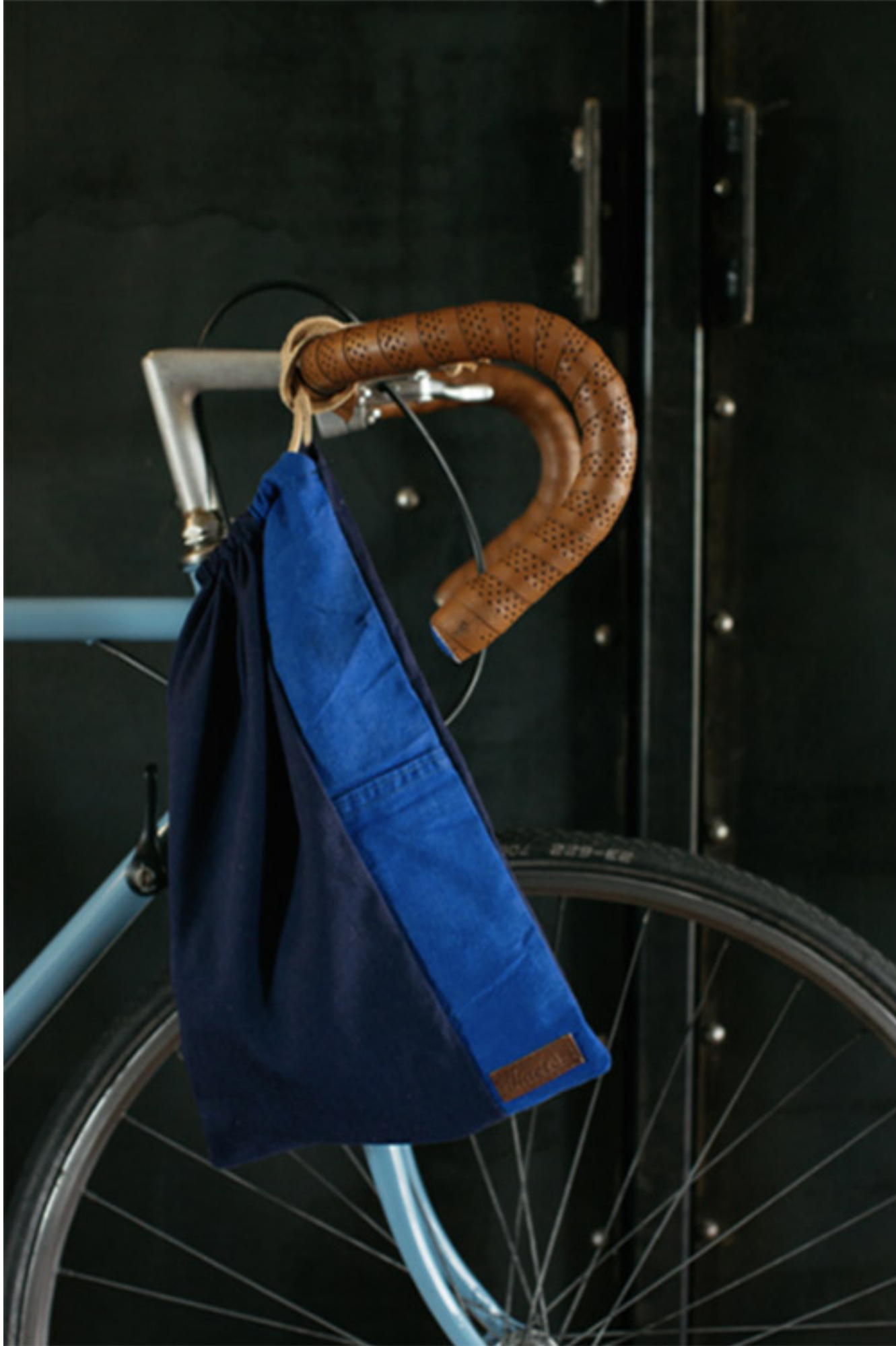
Sac en bleu de travail recyclé, Hacter

Dans la même idée, nous réfléchissons également à une boîte d'expédition (de vos achats web) en carton recyclé, qui puisse être réutilisable dans un autre contexte : boîte à archives, à chaussettes ! Et ceci en travaillant sur l'inviolabilité de la boîte sans utiliser la colle, mais uniquement sous forme de pliage.