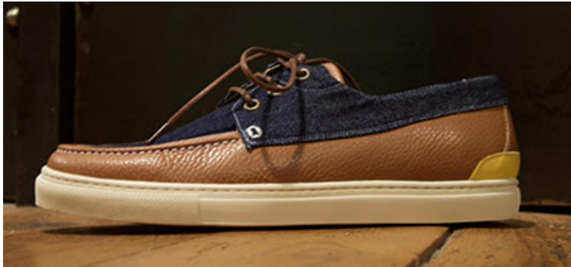
Chaussure bateau Hacter

C'est l'exemple de cette chaussure Hacter, qui redonne vie à un denim datant de 1986 !