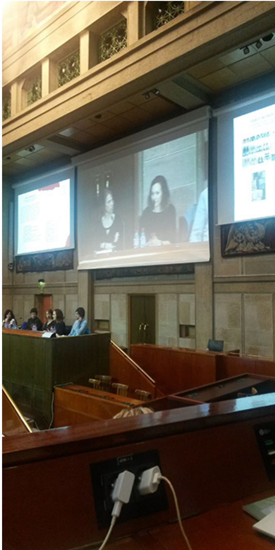
My Happy Wardrobe au Colloque Changeons la mode pour le climat, lundi 7 décembre 2015

Wardrobe, redonnons du sens à notre acte d'achat. Continuons à nous faire plaisir, mais limitons la consommation à répétition, sans but réel. Cette accumulation qui envahit nos placards, nous fait oublier les beaux objets sur lesquels nous avons craqués quelques mois auparavant. Et c'est cette accumulation qui nous donne ce sentiment de ne rien trouver dans nos dressings !