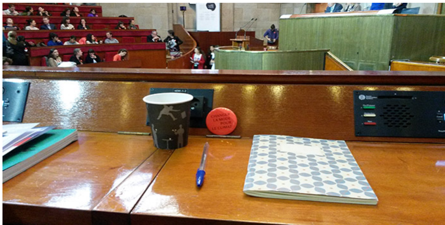
Colloque Changeons la mode pour le climat, 7 décembre 2015, Paris

Lundi 7 décembre 2015, nous sommes allés au Colloque Changeons la mode pour le climat , au CESE (Conseil économique, social et environnemental), place d'Iéna, à Paris.