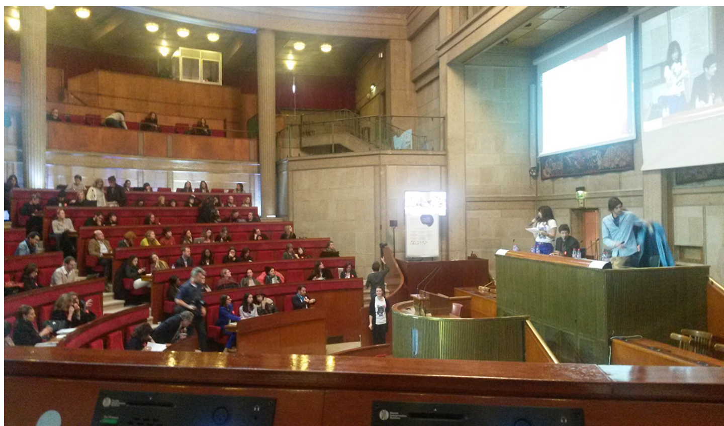
Colloque Changeons la mode pour le climat, lundi 7 décembre 2015

Cette journée au CESE fut très riche. De nombreuses idées ont été évoquées.